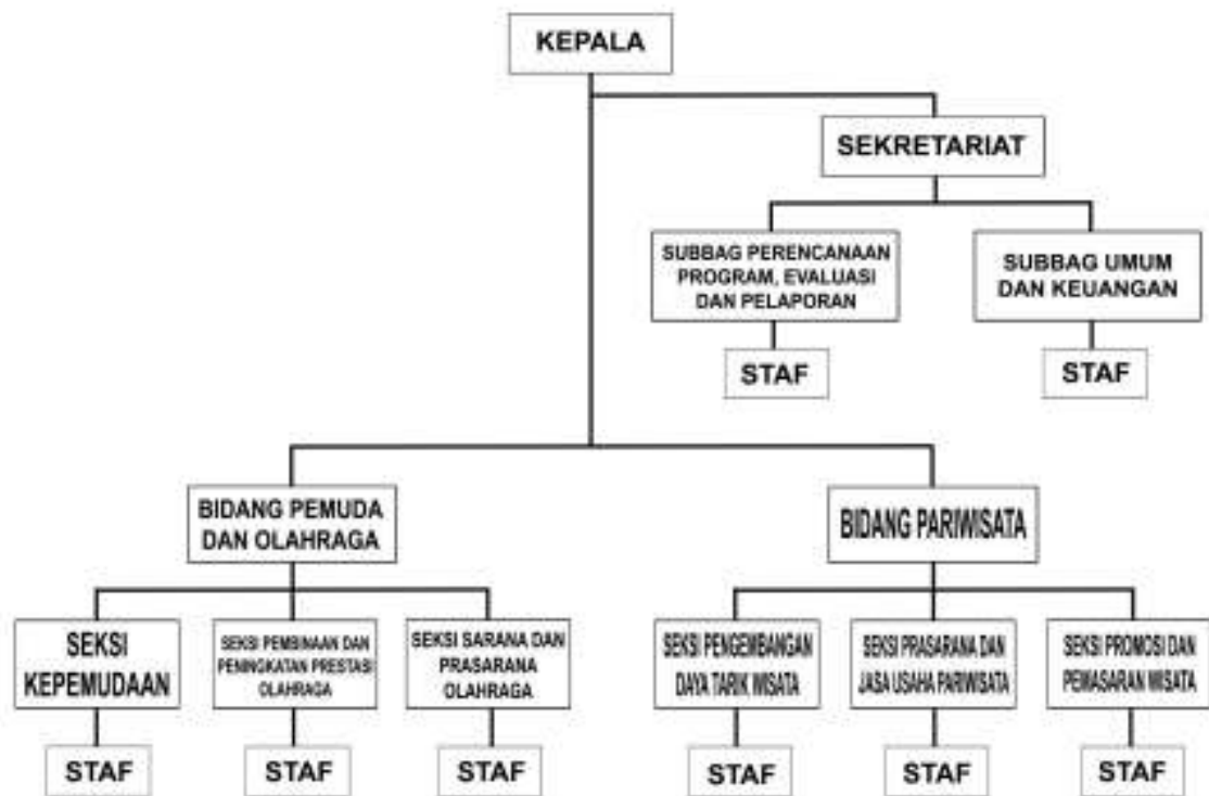
Gambar 1.1 Struktur Organisasi DISPARPORA